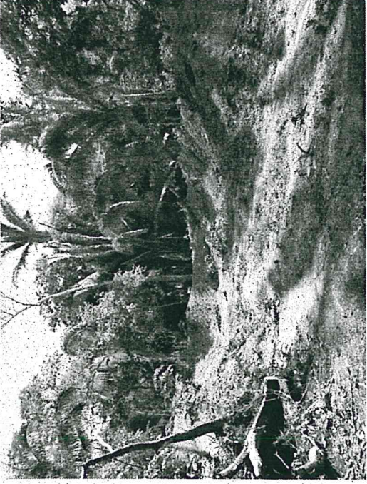
Vista de La Bolsa completamente relleno