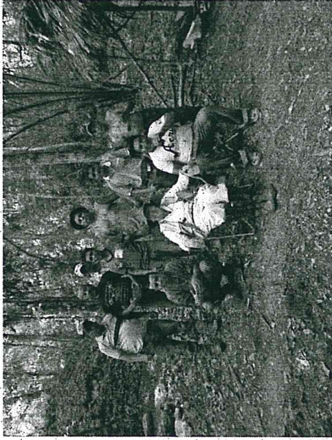
Equipo de excavación Plan Mayo 2017.