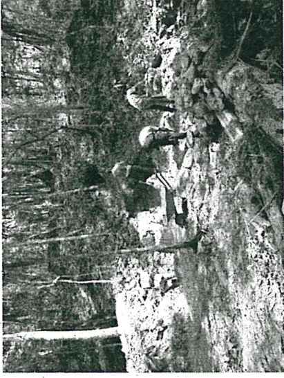
Saqueo # 4, liberando Estela # 7