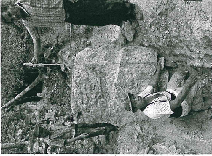
Actualmente, la Estela # 7 mide 1.40 de ancho x 1.30m de alto.