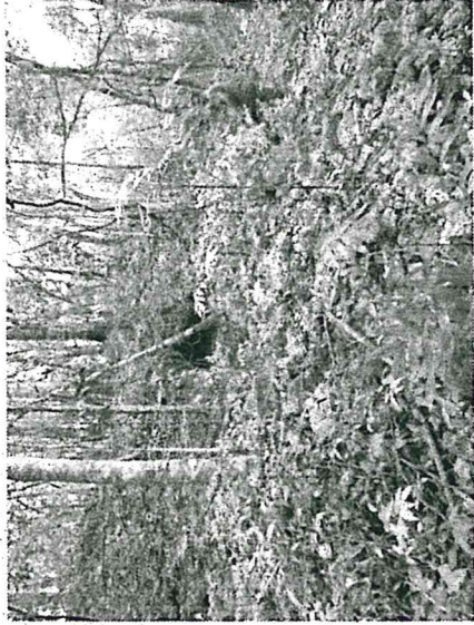
Saqueo # 4, Estructura A-11