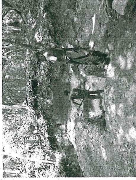
Liberando Fachada Sur de E-3