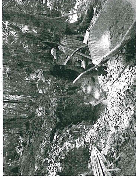
Investigando esquina SW de E-2